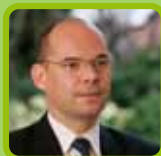
Xavier Lemoine Maire de Montfermeil