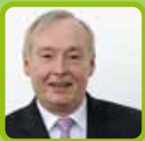
Claude Dilain maire de Clichy-sous-Bois