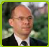
Xavier Lemoine maire de Montfermeil